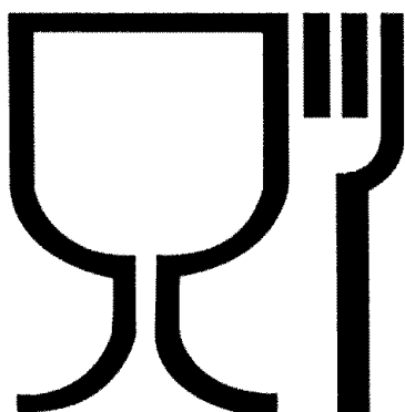
Рис. 1. Упаковка (укупорочные средства), предназначенная для контакта с пищевой продукцией

Символ, обозначающий, что упаковка предназначена для контакта с пищевой продукцией, допускается наносить как без рамки, так и в рамке (круглой, квадратной и др.).